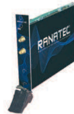
PXI-modulen RI 1801 är en svenskutvecklad digitizer med mycket hög dynamik.